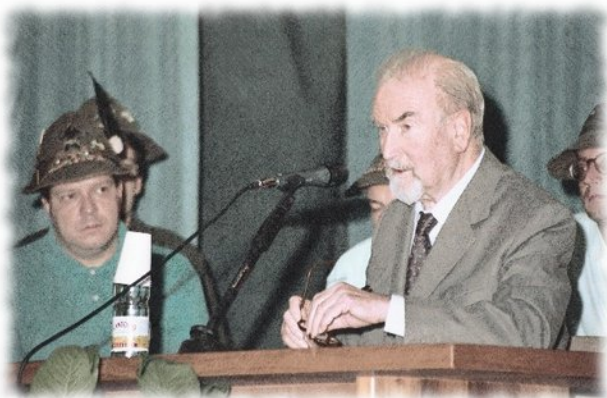
Eugenio Corti con i suoi alpini.

Il cavallo rosso è un grande affresco della nostra terra, della sua cultura (non solo cattolica, forse, come vuole Corti) e del realismo con cui è solita affrontare l'esistenza. Sotto la visione di una moderna filosofia della storia cattolica (spesso sembra che anche il cristianesimo stia stretto a Corti), si muovono uomini e donne che hanno una visione chiara della vita. Sanno cosa fare, conoscono il loro ruolo nel mondo, hanno — con una parola un po' datata oggi — una missione, sono gli eredi consapevoli di una tradizione. Peccato che Corti veda questo — almeno in positivo — soltanto dalla parte dei cattolici. C'è anche negli altri, anche se non emerge abbastanza dal libro,