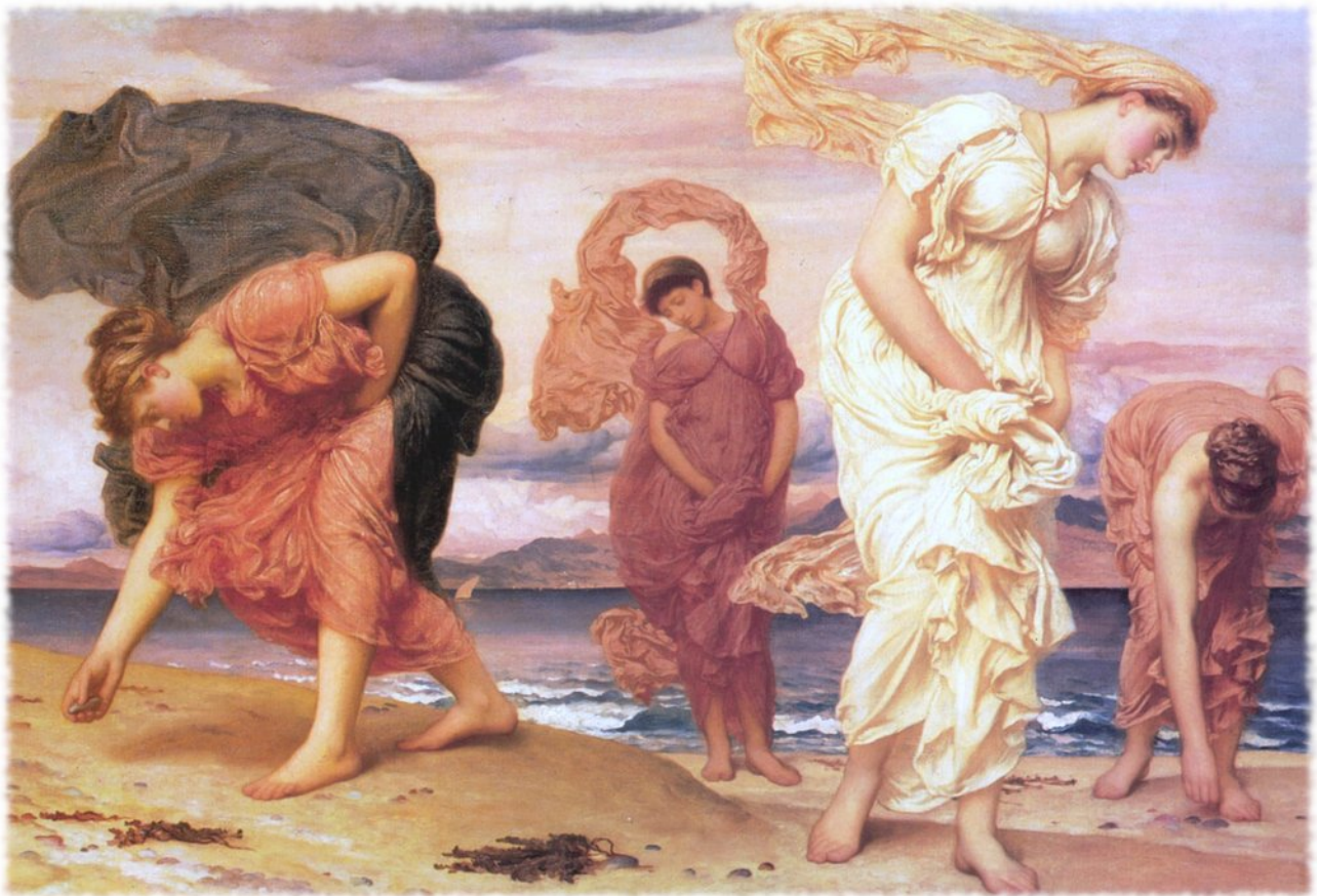
Frederic Leighton, Ragazze greche che raccolgono ciottoli in riva al mare , 1871.