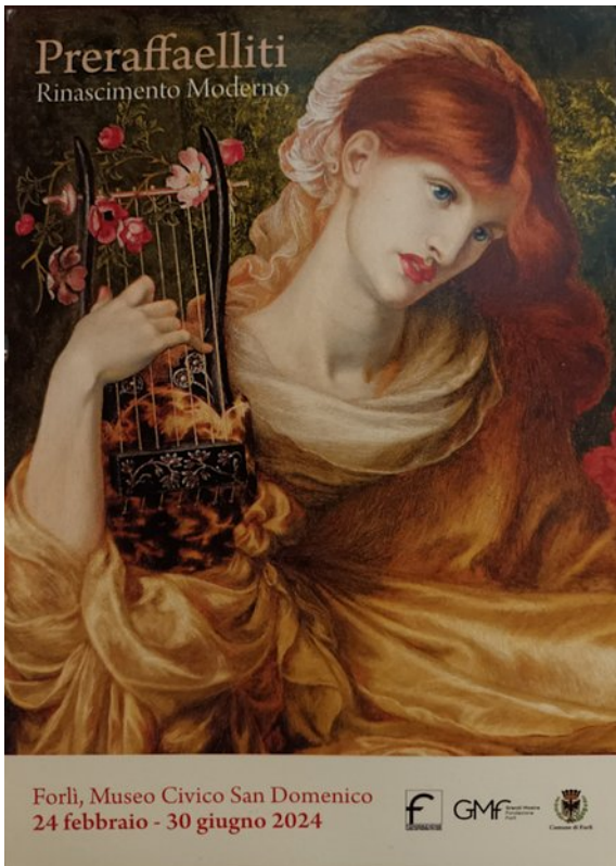
Dante Gabriel Rossetti, La vedova romana , 1874.