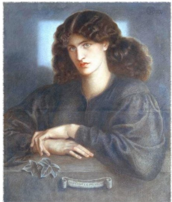
Dante Gabriel Rossetti, La donna della finestra , 1870.