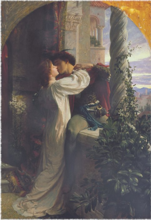
Frank Dicksee, Romeo e Giulietta , 1884.