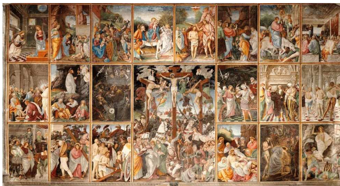
Varallo Sesia – Chiesa di S.Maria delle Grazie – La «Grande Parete» di Gaudenzio Ferrari

Il Santuario del Sacro Monte di Varallo ha un ottimo sito, www.sacromontedivarallo.it , ove sono reperibili tutte le informazioni storiche e pratiche e un aggiornato calendario di eventi.