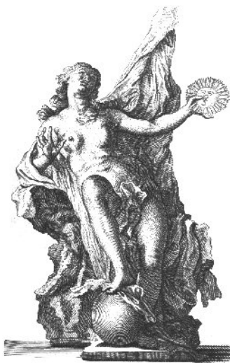
STAMPA DELLA VIZIA DEL GENOVA.