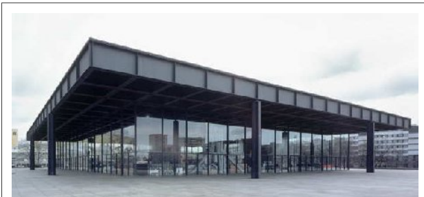
Bacardi Rum Factory , architetto: Ludwig Mies van der Rohe. Progettato per Santiago de Cuba, 1959 e non realizzato, lo stesso edificio è stato costruito a Berlino nel 1968 come la Neue Nationalgalerie. Questo è l'inizio della mercificazione dell'architettura come "industrial packaging".