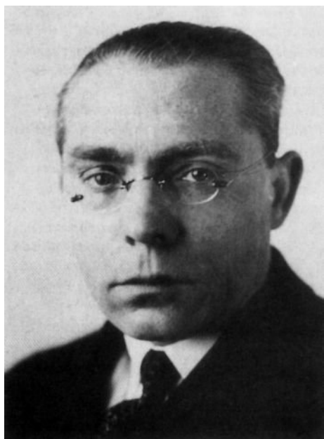
Ludwig Hilberseimer, insegnante al Bauhaus dal 1929 al 1933. Ideatore della città industriale inumana dove l'individuo perde l'identità e dunque la sua umanità, presa come modello per i campi di sterminio.

to dalle celebri fotografie in bianco e nero, non l'ho mai potuto vedere. Ho visto il rifacimento, che mi è sembrato il risultato di un attento studio filologico che si è potuto giovare dell'abbondante materiale di progetto tuttora esistente. Non si è trattato di una banale operazione di cartapesta. Avere la possibilità di girare tra quei travertini, quegli specchi d'acqua, quegli splendidi piani orizzontali e verticali, quelle divine proporzioni, mi è piaciuto molto. Sono di bocca buona? È possibile, anche se credo che per un'architettura come quella il rifacimento serio sia un'operazione legittima. Comunque professore mi lasci ancora esprimerle la mia stima e simpatia. — Pi.