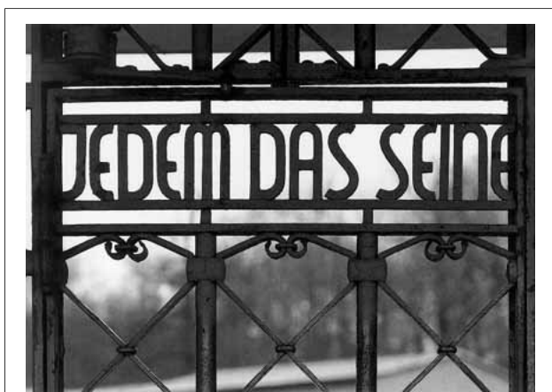
“Jedem das Seine”: “Ognuno ottiene quel che merita”, il cancello di ferro di Buchenwald con caratteri in stile generico Bauhaus (Grotesk), 1937.

Lei odia il Bauhaus, è legittimo, sono fatti suoi, un consiglio che le si potrebbe dare è di astenersi dall'usare questa terminologia estrema, per cui chi la pensa diversamente è un criminale, ma è solo un consiglio, faccia lei, in fondo quel che conta è la salute. Ossequi. — Pi.