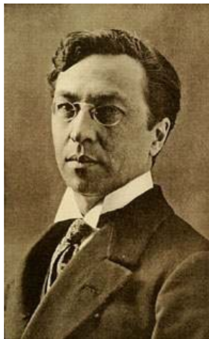
Wassily Kandinsky, il famoso pittore, insegnò al Bauhaus tra il 1922 e il 1933. Era un seguace della setta religiosa della Teosofia insieme a Paul Klee, Piet Mondrian e Theo van Doesburg. Fu il credo della setta a dettare l'uso esclusivo di colori primari sia nella pittura che nell'architettura.