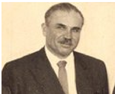
Ernst Neufert, laureato del Bauhaus e assistente di Walter Gropius. Autore del libro di dimensioni standard "Bauentwurfslehre" pubblicato nel 1936, e seguito da "Bauordnungslehre" che venne pubblicato dalla casa editoriale del Partito Nazista nel 1943 con l'aiuto di Albert Speer. Neufert venne incaricato da Speer nel 1939 di modularizzare tutta l'architettura tedesca agli standard industriali, un sogno del Bauhaus. Le dimensioni minime vennero adoperate per progettare i lager.

Così oggi s'impara l'architettura copiando i "maestri", senza riflettere. Ma quali sono mai le regole di questa Composizione Architettonica che genera mostri come alcuni Musei d'Arte Contemporanea, o certe Chiese adattate all'adorazione del loro progettista anziché di Cristo, Sale Espositive, Aeroporti e Stazioni Ferroviarie? Non ci sono. Si tratta soltanto di incantesimi per giungere all'ennesima, ritrita imitazione delle forme Bauhaus. — Nikos.