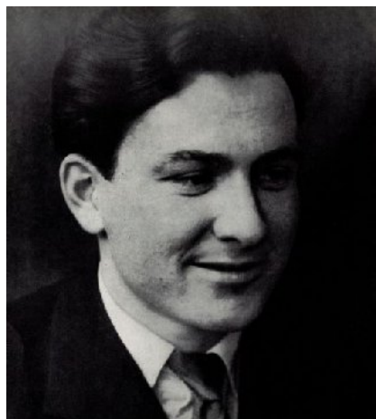
Franz Ehrlich, laureato del Bauhaus. Una storia ambigua: dopo esser stato incarcerato nel 1934 perché comunista, venne liberato e lavorò a progettare gli edifici e i mobili per Buchenwald. Ehrlich ha progettato i cancelli di ferro coronati dal motto "Jedem das Seine".

Certo che questo passaggio Le sfuggirà in eterno, ma non si può essere, come nel suo caso, preparato in composizione... La saluto. — Mauro.