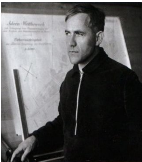
Hannes Meyer, docente al Bauhaus tra il 1927 e il 1930, e il suo secondo direttore. Meyer licenziò Herbert Bayer e Marcel Breuer. Walter Gropius lo allontanerà a sua volta dopo uno scandalo sessuale, e anche perché Meyer nutriva idee “troppo” comuniste.