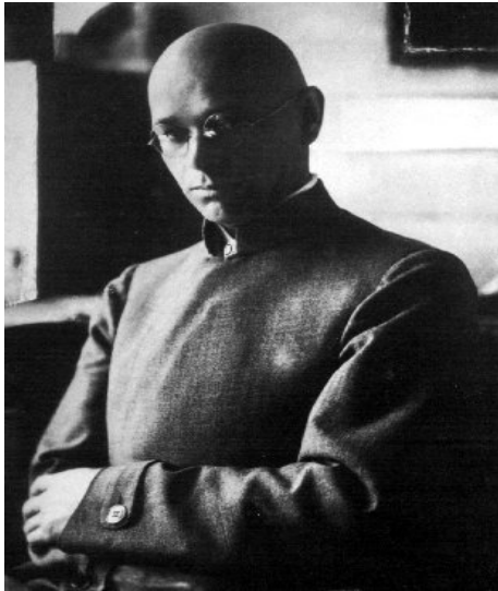
Johannes Itten, insegnante al Bauhaus fra il 1919 e il 1922, fu un membro della setta religiosa Mazdaznan alla quale convertì Georg Muche, nonché altri insegnanti e studenti del Bauhaus. Da qui le sue vesti monacali. Dopo essere stato espulso dal Bauhaus, lavorò con il noto Ernst Neufert.