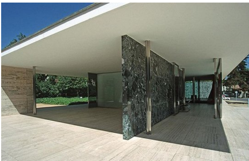
Barcellona. Il padiglione Tedesco, di Ludwig Mies van der Rohe.

Non ha alcun senso dibattere ancora oggi, a distanza di settanta anni, su Mies grande genio o grande demone come se fosse quello il