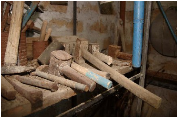
Gli attrezzi dello scultore.

creazione e distruzione; oggi, però, perseguiamo soltanto il secondo. Oltre all'ambiente che viene distrutto con rapidità preoccupante, è, infatti, l'anima umana ad essere danneggiata se non creiamo niente personalmente. Tutto oggi si deve comprare, tutto è un prodotto industriale, la possibilità di creare non esiste, è stata dimenticata nei decenni passati. I «contemporanei» hanno soltanto parole di condanna, e paura, per il passato, convinti che qualsiasi sguardo all'indietro sia un tradimento dello sviluppatore.