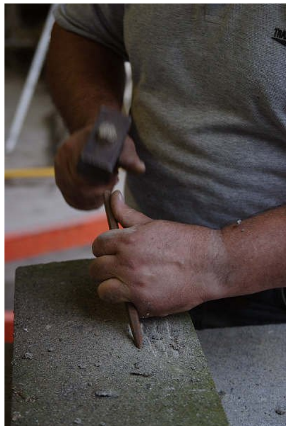
Le mani dello scultore.

Siamo costretti ad essere assai duri con la gente. Perché hanno voluto distruggere i legami con la natura, con l'anima umana, con l'esistenza di un ordine superiore? Gli uomini d'oggi hanno reciso i legami con il nutrimento generato dall'atto creativo, perché non creano più, confondono ormai la vera e propria spazzatura con l'arte, sono stati convinti che un museo pieno d'oggetti schifosi rappre-