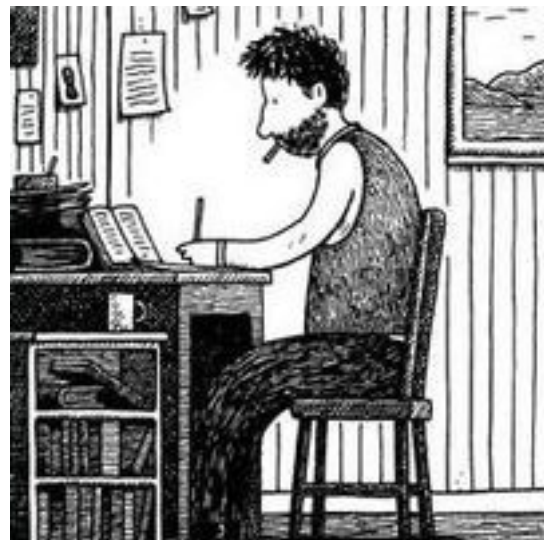
L'autore (da un disegno di ©Tom Gauld).