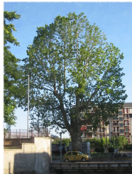
Via Grassi, Monza: 8 luglio 2008.