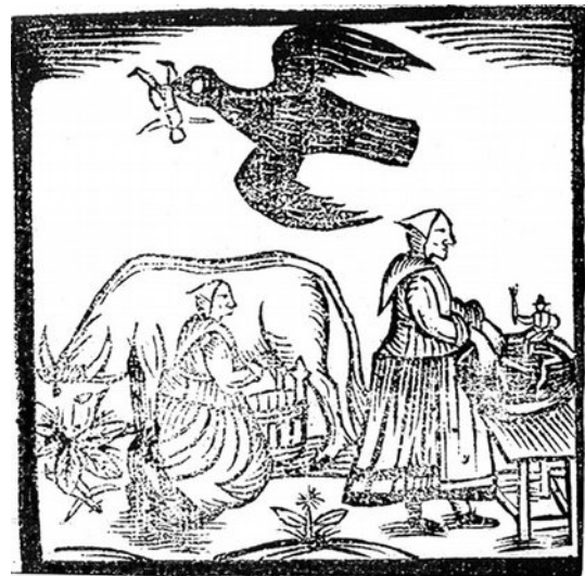
Tom Thumbe rapito da un uccello.