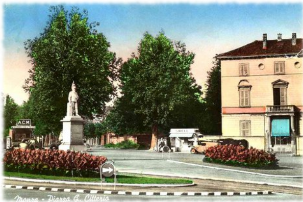
Figura 4. Distributori di benzina, l'Automobil Club Italiano, rotaie del tramway verso Carate Brianza.

Sono riflessioni da amanti degli alberi, da originali che si muovono su scenografie sempreverdi nello stesso identico mondo di tutti, in mezzo a chiunque, diversi da chi vive senza mai contemplare la flora ovvero l'altra storia. Come esuli in patria, essi camminano sulla medesima piazza del Re di sasso senza voltarsi ad ammirare l'auto che passa [figura 3]: per loro è solo una carrozza priva di cavalli, col motore sull'avantreno.