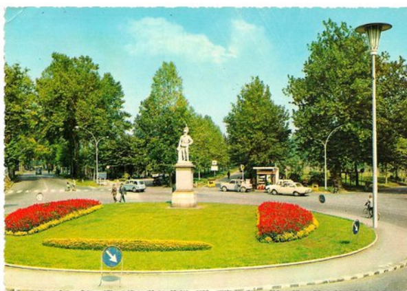
Figura 6. Il Re di Sasso a metà Novecento.

cartelletta della cartolina in Figura 6, in cui le auto scorrono in senso antiorario (anche oggi la viabilità va così, com'è ovvio) ma dove l'aiuola centrale assomiglia in maniera anamorfica a una curiosa pareidolia: una faccina aliena verde, con occhi rossi distanti e la bocca gialla sorridente? Un emoticon ante litteram ? Ignoriamo. Gli alberi torreggiavano già, muti, come fiamme avvampanti di fogliame.