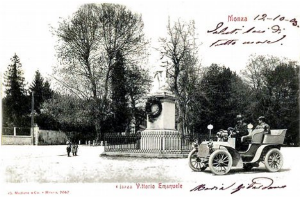
Figura 3. Il luogo in questione, cent'anni fa.

Sono riflessioni da amanti degli alberi, da originali che si muovono su scenografie sempreverdi nello stesso identico mondo di tutti, in mezzo a chiunque, diversi da chi vive senza mai contemplare la flora ovvero l'altra storia. Come esuli in patria, essi camminano sulla medesima piazza del Re di sasso senza voltarsi ad ammirare l'auto che passa [figura 3]: per loro è solo una carrozza priva di cavalli, col motore sull'avantreno.