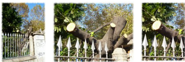
Figura 2. La potatura del lauroceraso.

e benché si senta come il piazzale rischi di prestare il fianco alle pericolose miglierie pensate nell'Ufficio-Giardini del Comune... I sogni degli architetti del verde sono l'incubo per qualunque albero che cresce in città. Basta avvicinarsi con la macchina fotografica e scattare la sequenza a tritico [figura 2] per smascherare la violenza delle cesoie, la libidine delle seghe del giardiniere: certo, siamo stati educati e recidere liane e a svellere fusti amazzonici, in altre ere, per liberarci il cammino tra i pericoli della foresta pluviale. Ma qui alludo a un altro genere di brutalità: