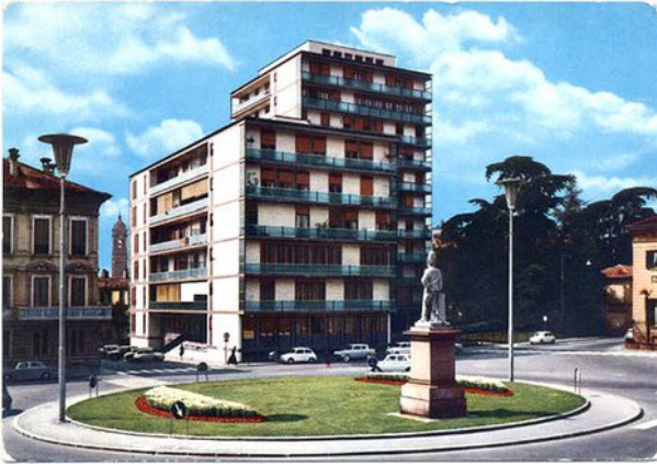
Figura 7. Il Re di Sasso visto di spalle.

chine passare sulla via a forte scorrimento verso Concorezzo; il succo della linfa era come irrancidito. E per combinazione il ragazzo dovette stare lontano da casa un anno intero, per il servizio civile, e percorreva altre strade; così spesso il destino ci preserva dal picco agro della tristezza, paternamente, mentre intanto devono succedere cose inevitabili. Si dice infatti che Leonardo sia morto nel 1994, forse in un asilo notturno o ricoverato in extremis per intercessione di un benefattore. 4