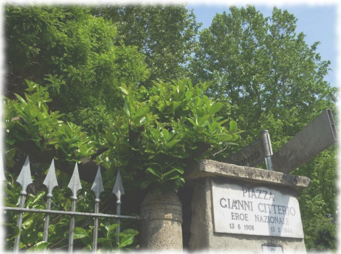
Figura 8. Il luogo in questione, oggi.