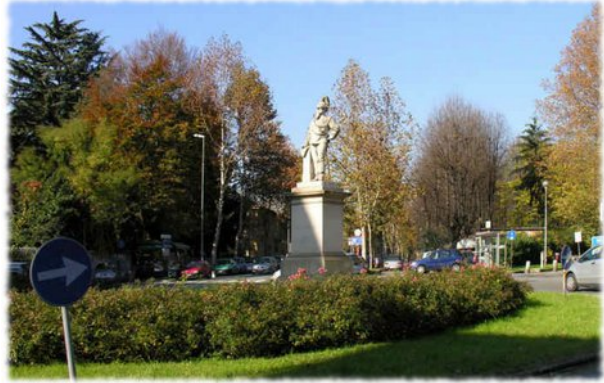
Figura 5. Il luogo in questione, oggi.

sant'Anna o morena glaciale senza un nome fornito dal linguaggio umano. All'ultimo, scenderà un silenzio lunghissimo, eloquente, indecifrato, armonico, amatissimo dagli uomini arborei che sempre si appellano a un giudice che «non sono gli altri».