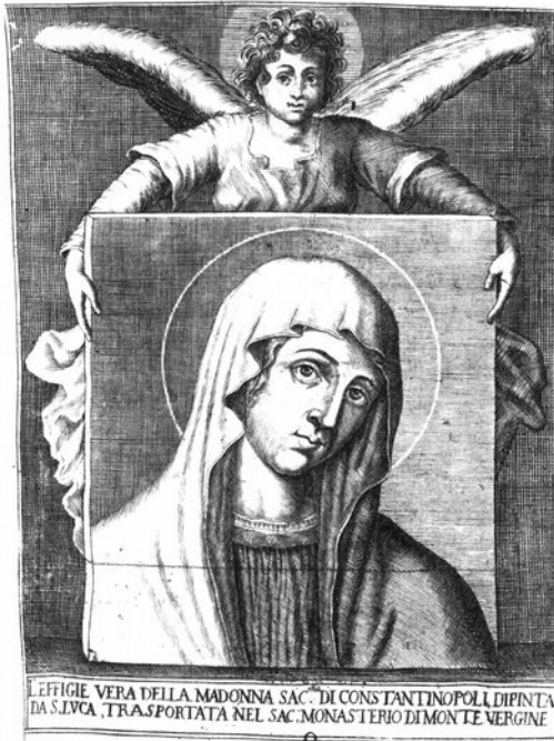
EFFIGIE VERA DELLA MADONNA SAC. DI CONSTANTINOPOLI, DIPINTA DA S. LUCIA, TRASPORTATA NEL SAC. MONASTERO DI MONTE VERGINE

Ortodossi e cattolici si sono già trovati uniti nel martirio sotto i totalitarismi del Novecento (il secolo del grande macello di cristiani) e di nuovo oggi si trovano perseguitati e uccisi insieme, soprattutto in Medio Oriente dove si stanno sradicando intere (e antichissime) chiese.