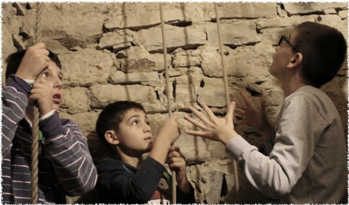
Ragazzi campanari di Foresto Sparso (Bergamo) 2017

pane piú grandi, poiché i loro batacchi erano fermati alla corda della campana e venivano «lasciati andare», con trucchi speciali, solo quando la campana era già in piena oscillazione. Ciò si faceva affinché ogni campana, una dopo l'altra, potesse iniziare a suonare con il suo pieno rintocco. Solo un orecchio esperto poteva quindi giudicare se ogni campana era suonata «in modo corretto», perché anche la conclusione del rintocco avveniva nello stesso modo, solo al contrario. I batacchi venivano «fermati» al momento giusto durante la piena oscillazione delle campane grandi, e guai a chi suonava in modo maldestro e lasciava «andare» la campana.