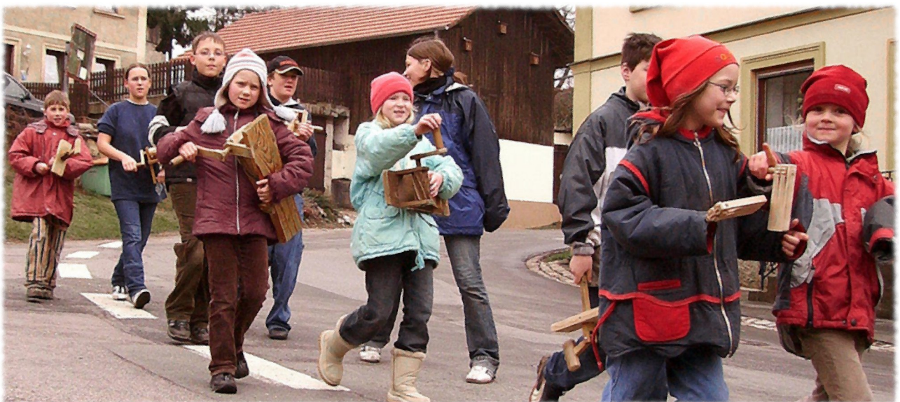
Giovedì santo 2017. Un gruppo di ragazzi con le raganelle a St. Wendeler Land.