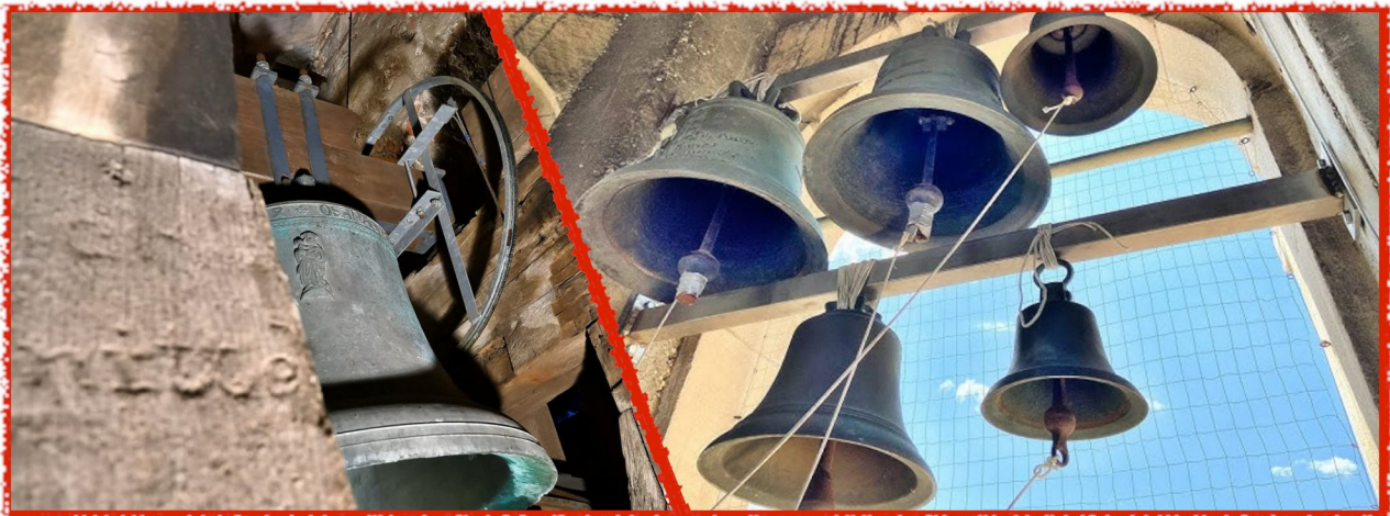
Campane del campanile di San Martino.

Oltre alle sette campane citate, sopra dell'ultima scala che portava alla cella campanaria era appesa la «campanella argentata della messa», la cui sottile corda scendeva per tutta la torre fino all'ingresso della sacrestia. Con questa campanella, il sacrestano dava ai suonatori in cima alla torre il «segnale» dell'inizio o della cessazione dei rintocchi durante l'Eucarestia.